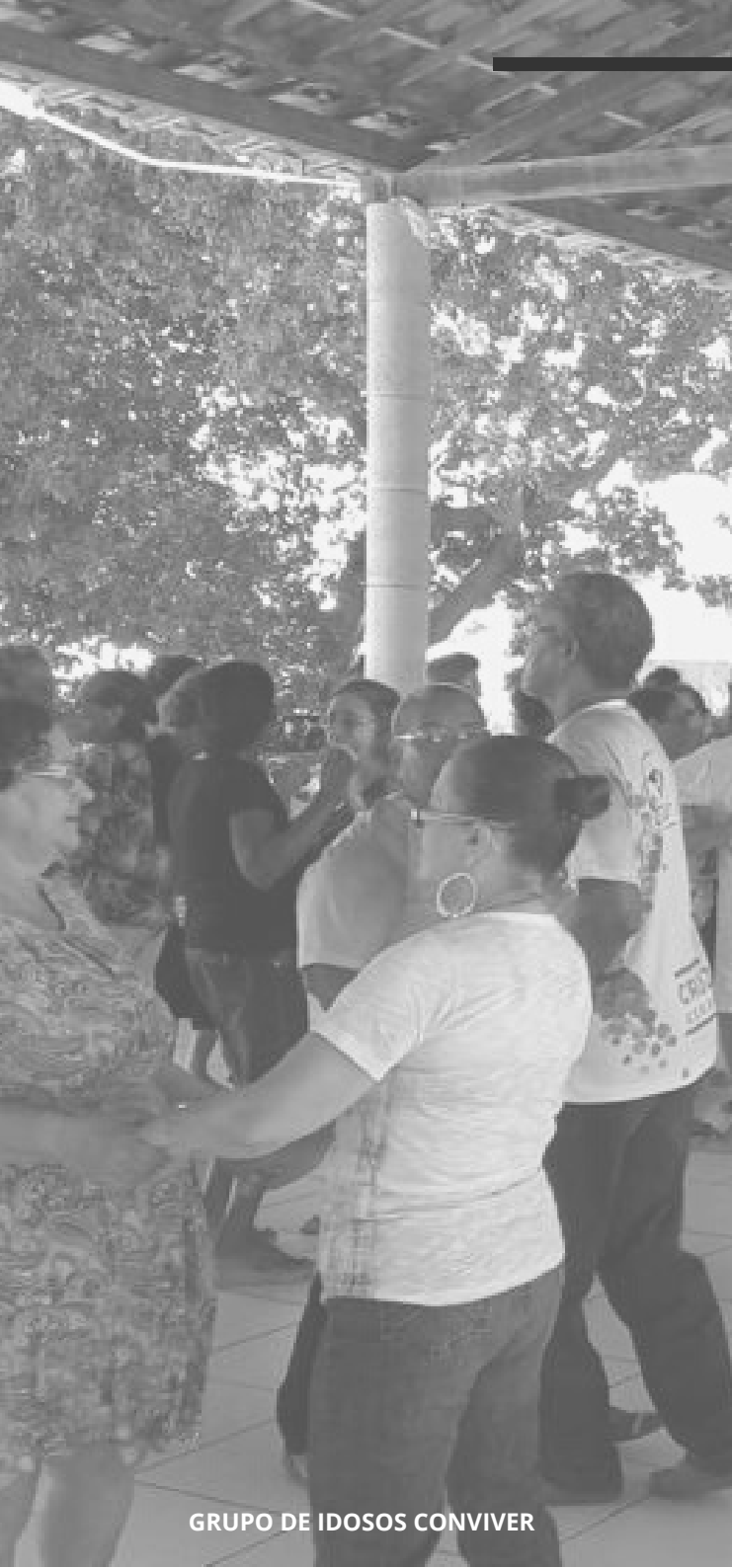
GRUPO DE IDOSOS CONVIVER